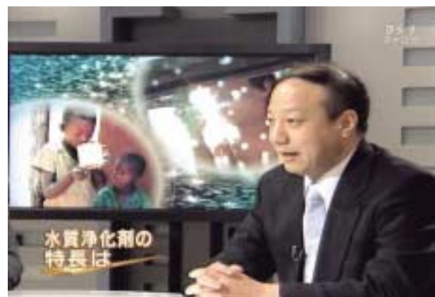
写真は、2009.4.9 NHK BS1「きょうの世界」より引用いたしました。