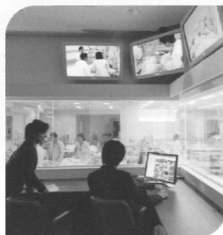
ホスピタルスタジオ