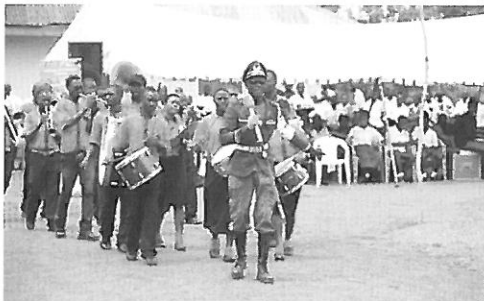
「3月22日 世界水の日」の演奏パレード

3月22日火曜日は「世界水の日」の大イベント当日。まず、HOIMA 県のモデル地区になっている Ngogoma Village へ向かいました。モデルハウスを取材、伝統的な村の暮らしの中で、Tippy Tap はもちろん、衛生的なトイレ管理、省エネかまどを住民が自信に満ち、満面に笑みをうかべて説明してくれました。