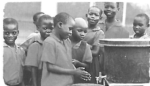
ユニセフが設置した手洗い設備で 手を洗うウガンダの子どもたち

クトは2010年から2012年までの3年間、アフリカ・ウガンダで100万人以上の住民の方々に正しい手洗いを伝えることで、子どもたちの命を守ることを目標とし、具体的な活動は手洗い設備の設置、学校や地域の自主的な衛生活動の支援、小さな子ども持つ母親への啓発活動、現地メディアでの手洗いキャンペーンの展開など、設備を整えるだけでなく、住民が石けんを使った正しい手洗いを知り、自ら広めていくことを目指して進められています。