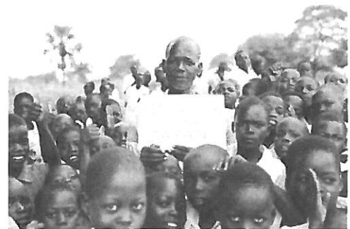
「負けるな、日本!」アチョリ語

これはとても大きな進歩で、生徒たちは自発的に手洗い習慣を身に付けていました。手洗い設備は目につく教室の前などに設置されています。壊されたり、盗難にあってしまうことを防ぐ措置です。残念ながら、昨年壊れていたコンクリートで土台をつくった大きな樹脂性の雨水タンクは修理するのが困難だったようで、そのまま放置されていました。自分たちで継続的にメンテナンスできることの大切さを痛感しました。ここで日本復興応援メッセージを撮影、スケッチブックに書かれたメッセージはアチョリ語で「BED MA CWINYU TEK JAPAN!」(Don't Worry! JAPAN = 負けるな、ニッポン!)