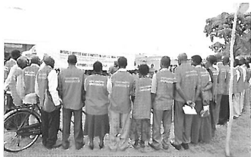
村のボランティア手洗い大使たち

イベント終盤には最優秀、優秀、優良、良まで4段階で Hand washing ambassador を表彰するセレモニーがおこなわれ、賞品として、それぞれ頑強な自転車 (中国製?)、マットレス、ラジオ、Tippy Tap 製作用のジェリー缶が授与されました。