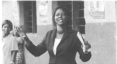
力強い演説口調の校長先生

3月21日月曜日はユニセフ・ウガンダ事務所視察目的と予定を確認し、早速、西部のKIBOGA県へ出発。今年初めて訪問するKambugu小学校で先生と子どもたちの歓待を受けました。力強い女性の校長先生の説明で、活動の進捗と現場の要望を聞いた後、少し恥じらい気味の低学年の子どもたちがTippy Tap (簡易手洗い設備) の実演を素敵な歌にのせて見せてくれました。