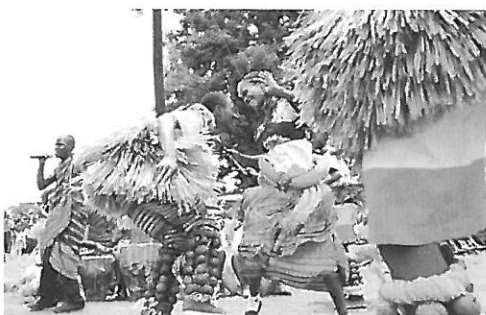
ニョロ族のダンス

そして「世界水の日」イベント会場に到着、このHOIMA 県の主要部族は、穏やかな性格といわれるニョロ族です。ウガンダは多民族国家です。その中で、ニョロ族はかつて17世紀中ごろに最盛期を迎えたブニョロ王国を築いた名門部族です。(19世紀には現在の王族を擁したブガンダ王国が全盛期を迎えることになります。)ニョロ族は穏やかな民族と言っても、パレードやダンスは、さすがにアフリカの息吹を感じるエモーショナルなパフォーマンス (Webで動画公開中)。