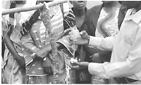
石けんを食べるヤギ対策にPETボトルカバー