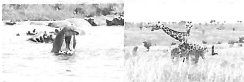
ヴィクトリア・ナイル川を渡る UN 車 アフリカゾウ!カバ!ウガンダキリン!

GULU 県に到着するとユニセフ GULU の職員と合流し、北部を代表するアチョリ族の PADER 県へ向かいました。去年はほとんど何もできていなくて支援校に指定した Amilobo 小学校を再訪。旧校長先生も来てくれました。ユニセフによって設置された手洗い設備を確認し、新校長先生取材。新たに生徒によって組織された Sanitation Club が校内活動を開始していました。