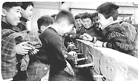
薬用石けんを手を洗う日本の子どもたち(昭和高度成長期)

戦後間もない日本において、赤痢などの伝染病が多発する中、私が勤める会社は1952年に創業し、緑色の薬用石けん液と、点滴式石けん液容器を同時開発しました。それ以来、うがい薬と自動うがい器、アルコール手指消毒剤と自動手指消毒ディスペンサーなどの製品を開発し続け、日本の衛生環境の向上に貢献してきました。