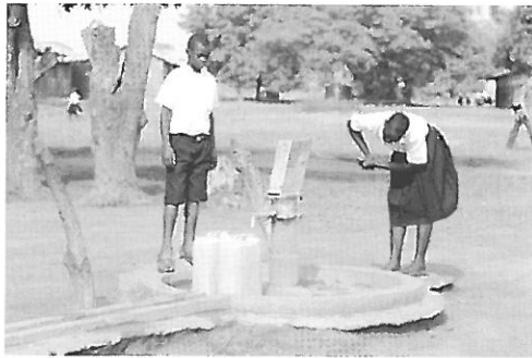
典型的な手押し井戸

学校横にある手押し井戸（たぶんインディーマークⅡ？）に水汲みにいくのも生徒たちの日課です。説明してくれた若い男性教諭からはひしひしと熱心さが伝わってきました。大切なのはリーダーの意識の変化だと思いました。