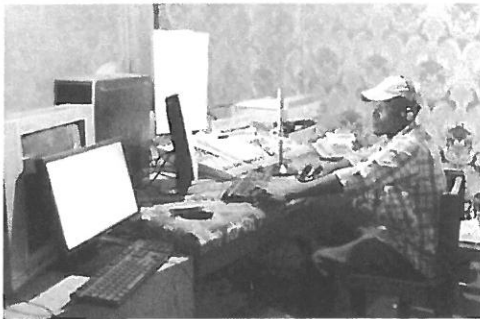
手洗いキャンペーンを報じるDJ