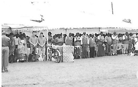
イベント会場全員で東日本大震災に黙祷

イベント最後のHOIMA 県 Chair Person (知事) の演説の終わりに、日本からやって来た視察チームが紹介され、東日本大震災の被災状況についても説明をされました。続いて、イベント参加者全員で黙祷が捧げられました。