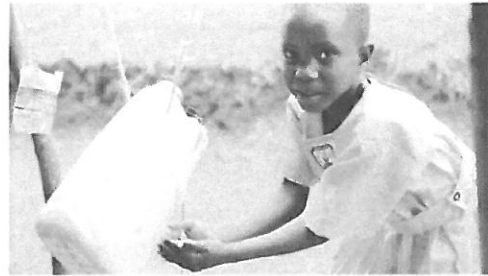
Tippy Tap (簡易手洗い設備) を使う少女

3月21日月曜日はユニセフ・ウガンダ事務所視察目的と予定を確認し、早速、西部のKIBOGA県へ出発。今年初めて訪問するKambugu小学校で先生と子どもたちの歓待を受けました。力強い女性の校長先生の説明で、活動の進捗と現場の要望を聞いた後、少し恥じらい気味の低学年の子どもたちがTippy Tap (簡易手洗い設備) の実演を素敵な歌にのせて見せてくれました。