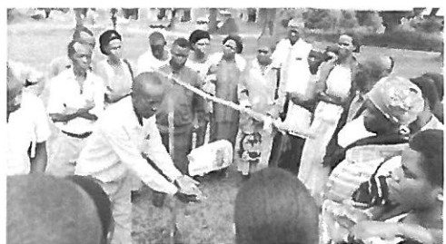
村の手洗いリーダーによるTippy Tap講習会

その後、今回の視察で現地が最も力を入れてアレンジしてくれたHOIMA県Buhimb Sub Countyの「3月22日世界水の日」イベント会場へ。夕方、現地に到着すると、翌日のイベントのために村民ボランティアのHand washing ambassadorによってTippy Tapの作り方の講習会が開かれていました。