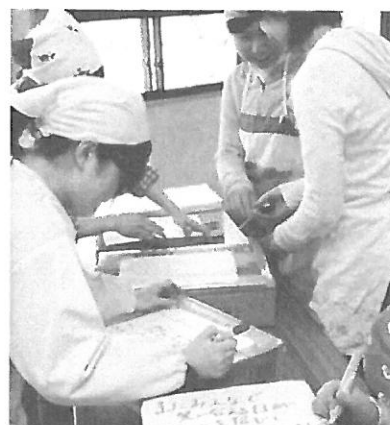
14万食のおにぎりにメッセージを添えて被災地に届ける。