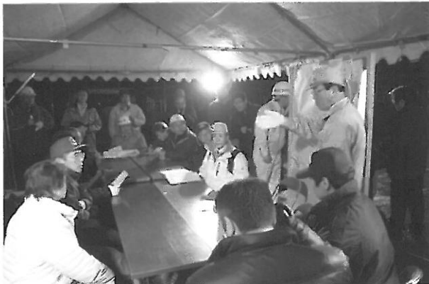
写真2 余震が続く中、市役所庁舎前駐車場テント内に緊急対策本部を設置

をインターネット回線で結び、岩手医科大学附属病院におかれたサーバーに県内妊産婦の健診情報を集約。地域保健・医療関係者の綿密な連携を図り妊産婦をサポートするシステムです。