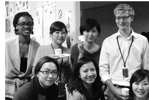
インターン・ボランティアの仲間

インターンシップ・プログラム卒業時には、研究発表の機会が与えられ、その成果は毎年センターから発行されている、年次報告書で報告されます。