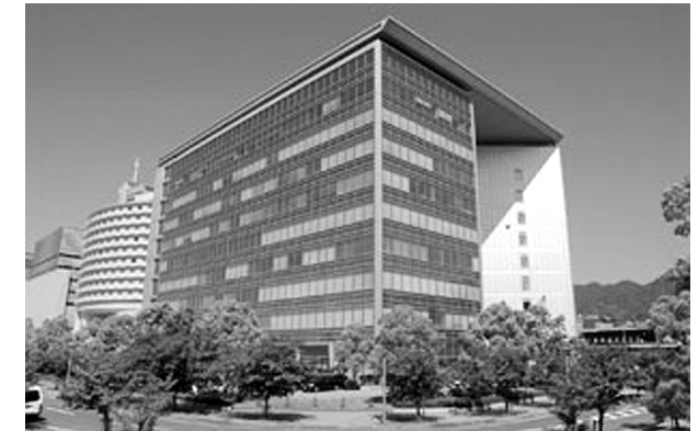
I.H.D. センタービル9階に WHO神戸センター

「6ヶ月続けて勤務できない」、「常勤できない」「すでに学位を取得している」など、学術的な条件は満たしているものの応募条件を満たせない方については、インターンではなくボランティアとして研究のお手伝いをしていただくこともできます。条件・応募方法については、インターンシップと同じです。