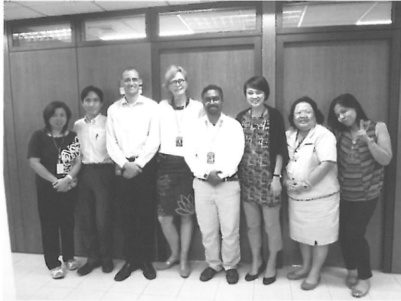
(結核・ハンセン病対策課の皆さんと)