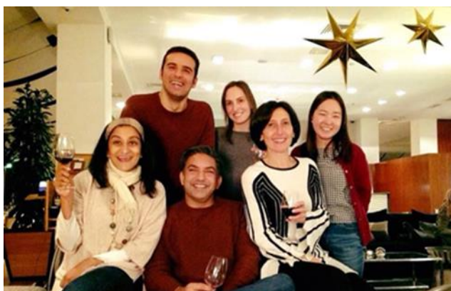
Health workforce department の上司や同僚と

私は2017年9月から3か月間、スイスのジュネーブにある世界保健機関本部のHealth workforce departmentにてインターンシップを経験しました。インターンシップの前にはロンドン大学キングスカレッジ国際保健修士課程にて保健医療人材教育を専攻していました。今回のインターンシップでは、主にユニバーサルヘルスカバレッジを達成するためのGlobal Competency and Educational Standards Frameworkを作成するプロジェクトを担当しました。