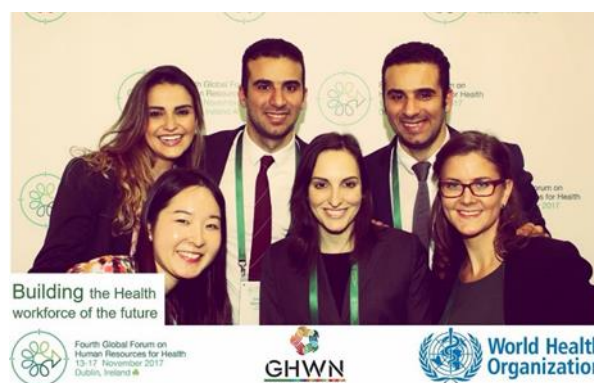
The 4th Global Forum の会場にて

その後、チームでここまでのプロジェクトの過程を“A Global Competency and Educational Standards Framework for Universal Health Coverage Working Group Draft for Discussion”として論文にまとめ、The 4th Global Forum on Human Resources for Healthで発表を行いました。このフォーラムでは、プロジェクトに対して多くのフィードバックをいただくことができました。それらを考慮に入れたうえで2018年度より実際にフレームワークの作成が始まる予定です。