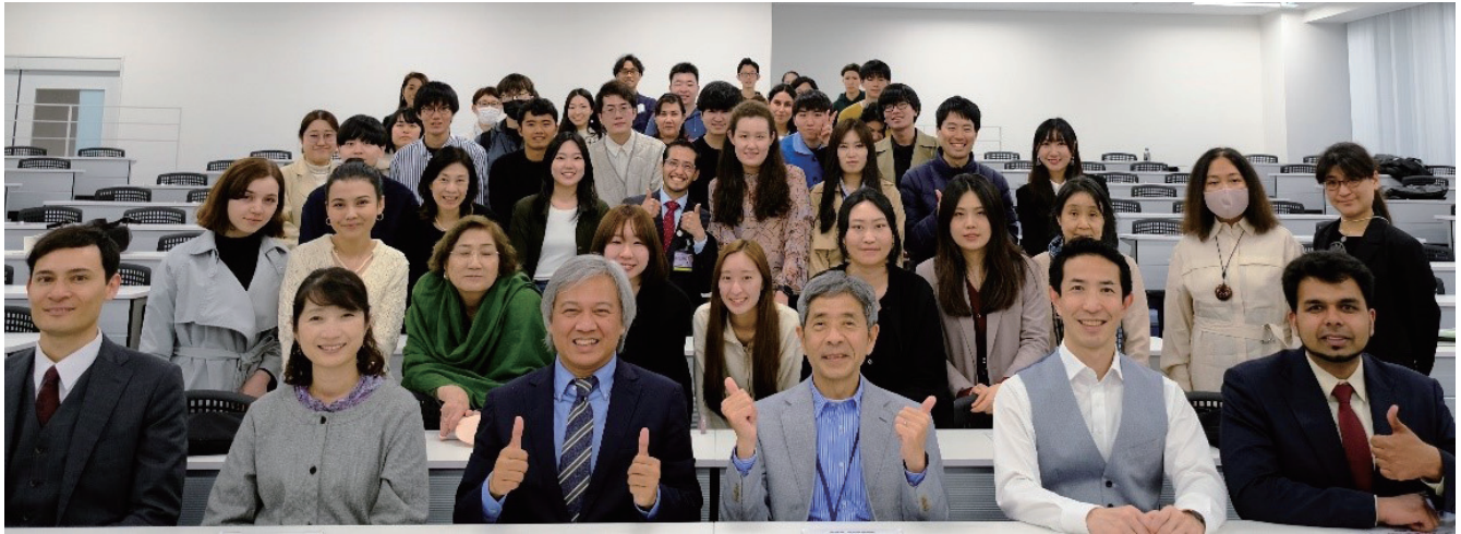
▲大学院グローバルヘルスリサーチ研究の教員と大学院生：先生も学生も多国籍