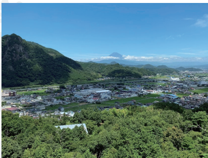
▲研究室の研究教育拠点がある静岡県伊豆の国市はNHK大河ドラマ『鎌倉殿の13人』の舞台となった富士山が望める風光明媚な土地

大学院の修士課程では、主として日本語を使用するグローバルヘルス学位プログラム（春入学）があり、さらに2024年10月には全教科英語を使用するグローバルヘルス学位プログラム（秋入学）が開講されます。グローバルヘルスでご活躍の国内外の一流の教授陣から最新の話題や対策を学ぶことができます。博士課程も同様に、主として日本語を使用する春入学コースと全教科英語を使用する