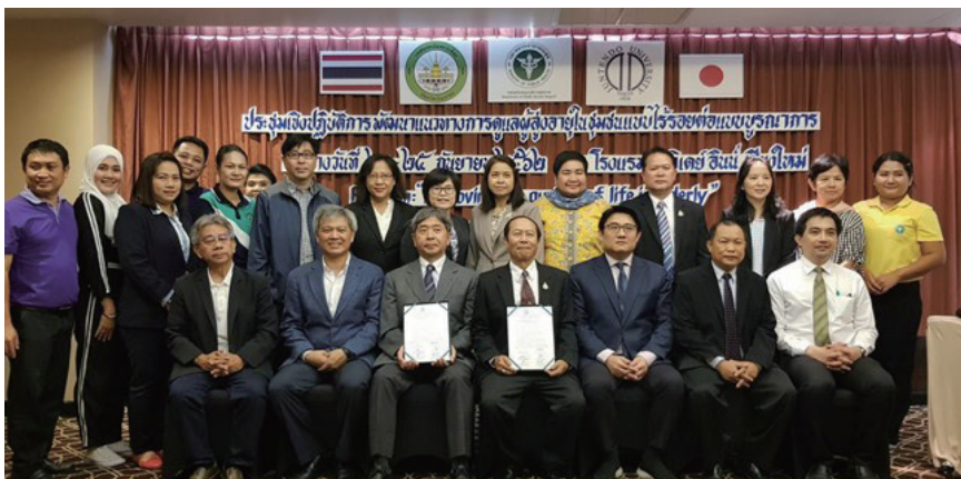
▲グローバルヘルスリサーチ研究室はタイ王国公衆衛生省と定期的な会議を行っています