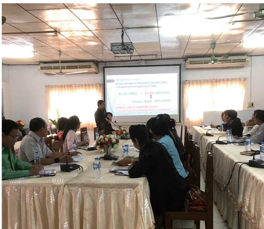
写真2 ラオス国出産安全調査の報告会（ラオス国アッタプー県）

このように、実践を意識したやりがいのある研究、海外では得られない濃密な学びを展開しているのがTSPHです。論文を書くことは重要ですが、それにとどまらず、一緒に問題解決と実装を考えていきませんか？