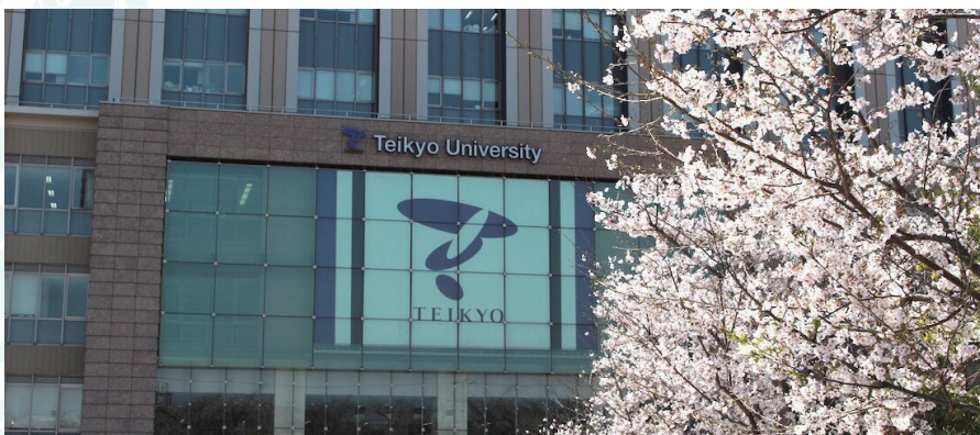
写真1 帝京大学の正面風景 http://www.med.teikyo-u.ac.jp/~tsph/

これまでに、多くの院生が学びを深めてくれました。例えば、ラオスでの出産安全に関する研究、アンゴラでの母子健康手帳に関するランダム化比較試験の研究、WHO が提唱する保健システム強化の実装に関する研究、日本国内での災害