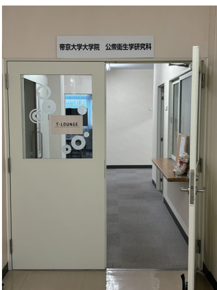
写真3 大学院生のために設定されたコワーキングスペースT Loungeの入口