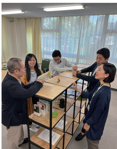
写真4 T Loungeでの大学院生たちとのディスカッション風景（筆者：左端）