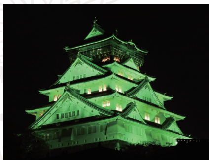
写真1 大阪城のライトアップ