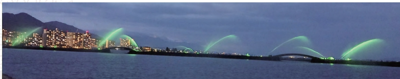
写真2 滋賀県大津港びわこ花噴水のライトアップ