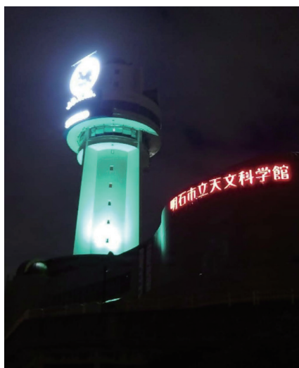
写真3 明石市立天文科学館のライトアップ (明石市の許可をえて掲載)