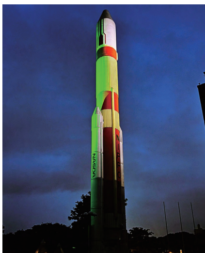
写真4 つくばエキスポセンターのライトアップ (つくばエキスポセンターの許可をえて掲載)

本会では、上記と並行して、啓発と連携の実効性を高めることを目的に、世界禁煙デー後の6月7日にオンラインセミナー「世界禁煙デー協賛:いのち輝け「タバコ対策で健康寿命をのばそう!」健康寿命を延ばすためのタバコ対策と課題、大阪府条例、妊婦禁煙支援の課題、YGLの事例」の開催を企画しました 3) 。(日本WHO協会の後援もいただきました)